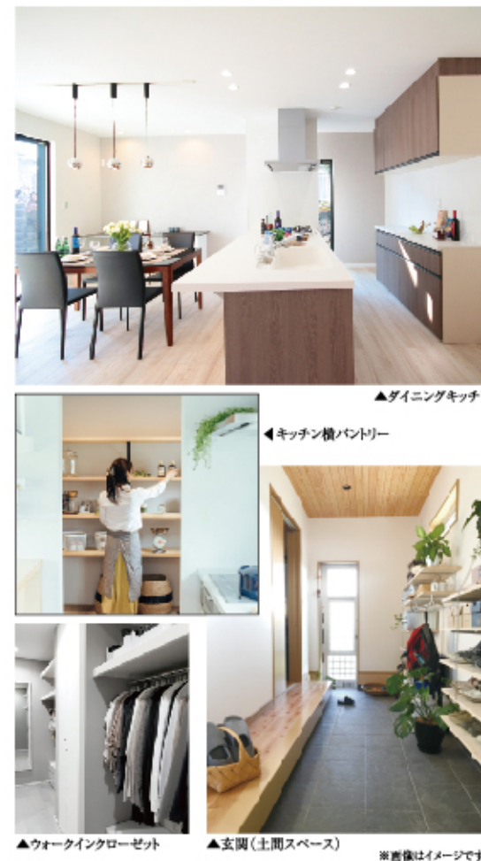
▲ダイニングキッチン