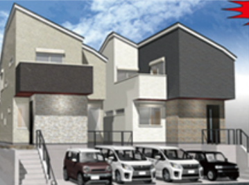
イメージ街並みパース

土地価格 2,970 万円 全て建物価格に含まれています ■消費税 ■建築確認費 ■水道市納金 ■住宅瑕疵保険料