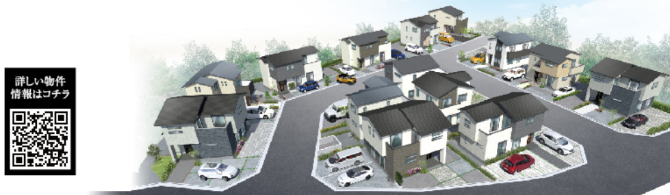
【街並みイメージパース】