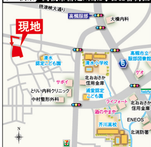
ナビ検索 高槻市宮之川原5丁目43番街区