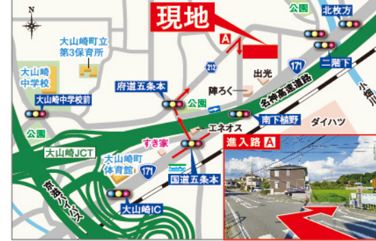
ナビ検索 京都府乙訓郡大山崎町下植野山王前5

【物件概要】●所在地/京都府乙訓郡大山崎町下植野山王前●交通/阪急京都線「西天台山」駅徒歩約20分●土地面積/約85.00㎡～約100.04㎡●私道負担/なし●総区画数/全14区画●開発許可番号/京都府乙訓土木事務所指令第5乙土建第1号の4(令和5年3月30日)●建物構造/木造2階建●建物価格/4LDKPLAN:105.10㎡/1,907万円(税込)●地目/宅地●用途地域/準工業地域●建ぺい率/60%●容積率/200%●設備環境/関西電力・大阪ガス・市営水道・公共下水●現況/更地●引渡し/相談