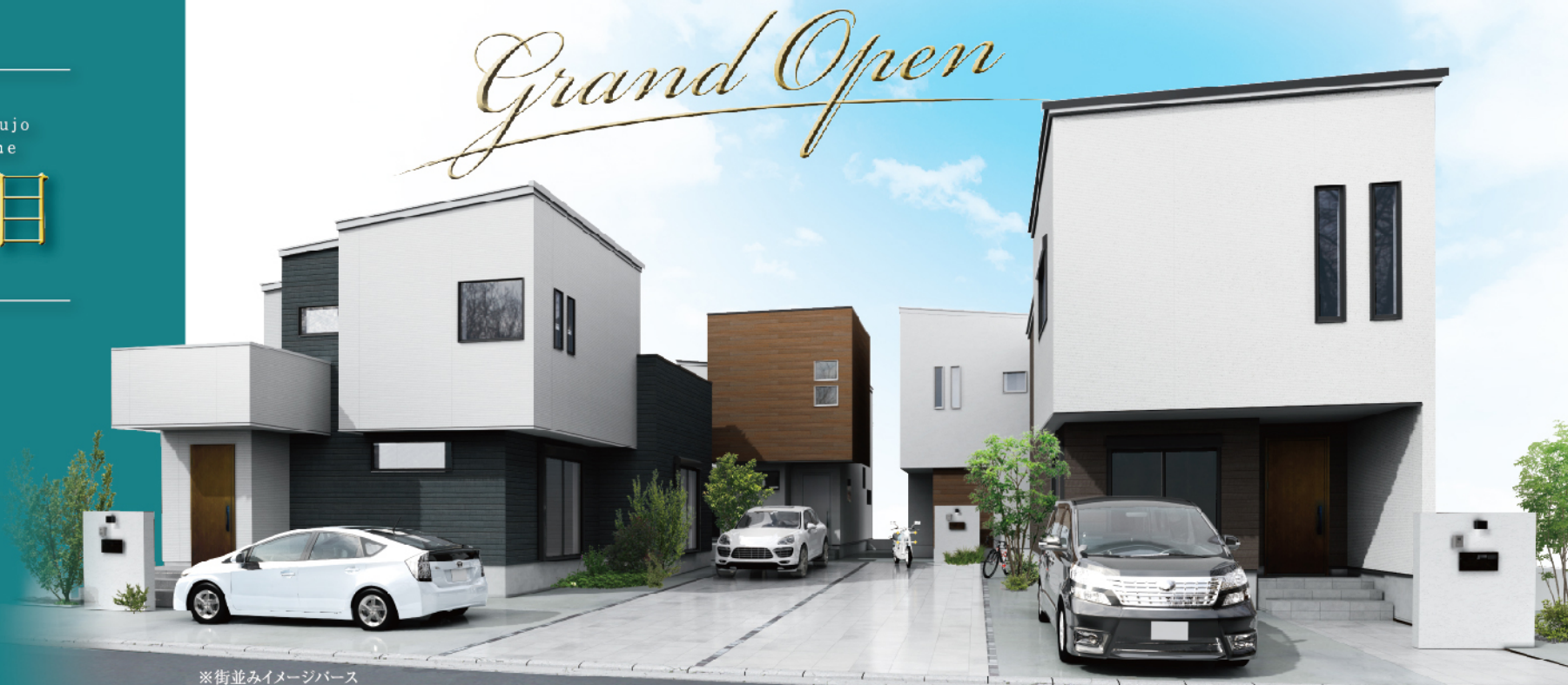
※街並みイメージパース