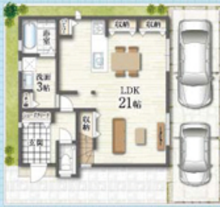
(プラン図に付き、図取変更可)