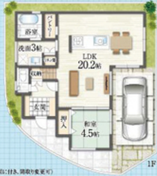
(プラン図に付き、図取変更可)